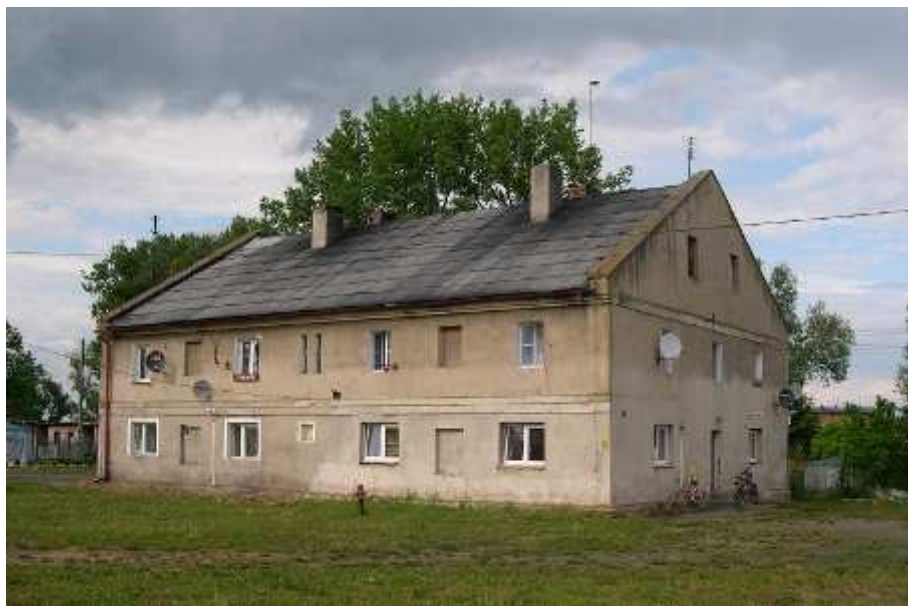
Dwór w Szymocinie oraz zabudowania mieszkalno – gospodarcze dawnego majątku.