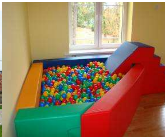
Zdjęcie po stronie lewej - Przedszkole w Grębobocicach, zdjęcie po stronie prawej - basen z piłeczkami dla dzieci.

Sport: Infrastruktura sportowa w Grębobocicach jest bezpośrednio związaną ze szkołą podstawową i gimnazjum. Szkoła i gimnazjum posiadają własną salę sportową i boisko wielofunkcyjne. Natomiast w jej sąsiedztwie znajduje się kompleks boisk: pełnowymiarowe trawiaste do gry w piłkę nożną oraz boisko wielofunkcyjne o nawierzchni poliuretanowej.