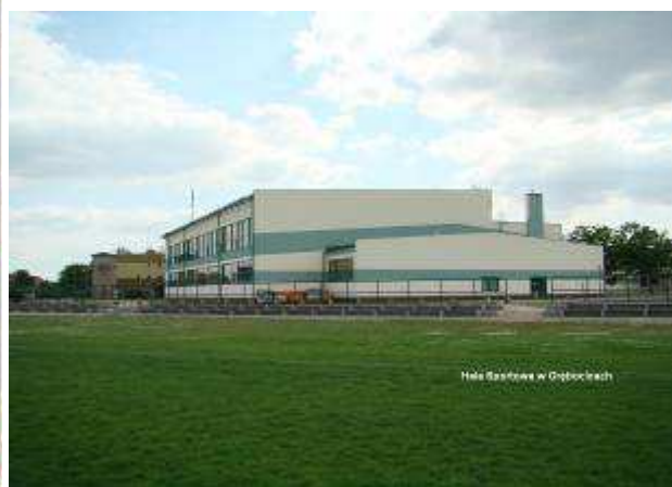
Fot. Archiwum Urzędu Gminy Grębobocice. Zdjęcie po stronie lewej - Hala sportowa (widok wewnątrz), zdjęcie po stronie prawej - Hala sportowa (widok na zewnątrz).