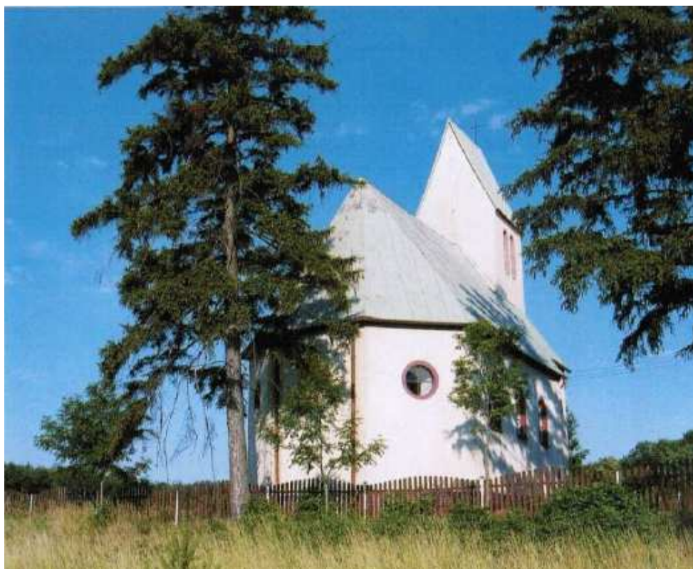
Kościół filialny p.w. Św Kazimierza w Obiszowie