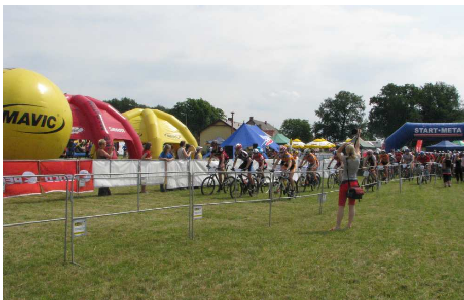
Miasteczko rowerowe podczas Pucharu Dolnego Śląska MTB w Obiszowie w 2010 roku

Na obszarze miejscowości Obiszów można wyróżnić dwa obszary, które stanowią centra publiczne o szczególnym znaczeniu dla zaspokajania potrzeb społecznych mieszkańców. Jako pierwsze z tych miejsc należy wyróżnić świetlicę rekreacyjną, wraz z kompleksem rekreacyjno-sportowym znajdującym się w jej sąsiedztwie. Świetlica wiejska w Obiszowie jest bardzo dobrze wyposażona, dzięki czemu umożliwia mieszkańcom organizowanie różnego rodzaju imprez o charakterze lokalnym, a także stwarza doskonałe miejsce dla spotkań Koła Gospodyń Wiejskich i kółek zainteresowań. Znajdujące się w pobliżu świetlicy boisko stanowi idealne miejsce do organizowania imprez o charakterze masowym, to właśnie w tym miejscu rozbijane jest miasteczko rowerowe podczas organizowanych w Obiszowie Rajdów MTB.