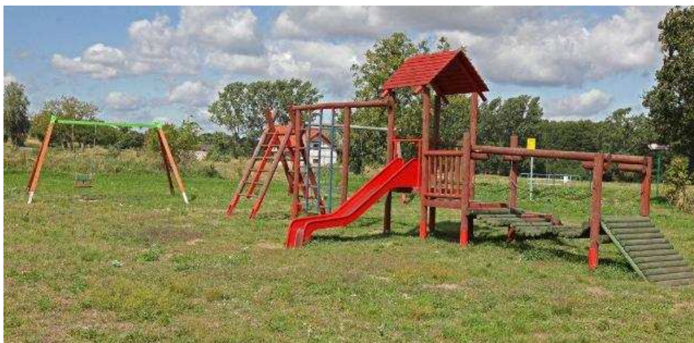
Plac zabaw w Obiszowie