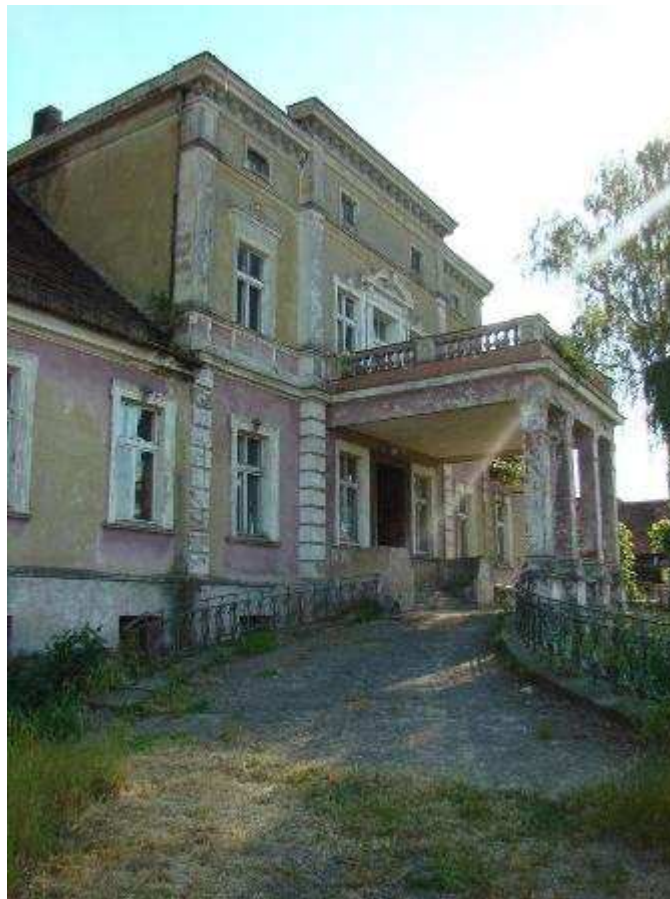
Pałac w Obiszowie