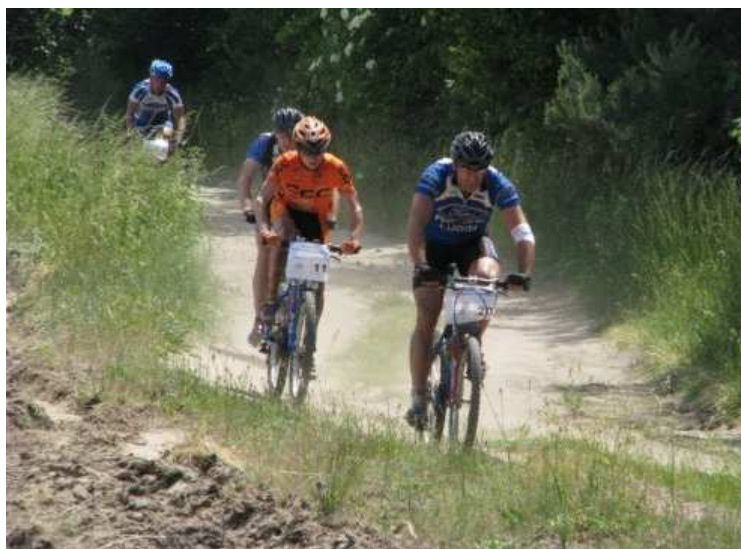
Mistrzostwa Dolnego Śląska MTB Obiszów 2010