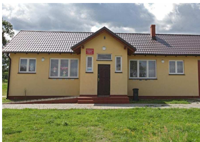
Zdjęcie po stronie lewej siedziba świetlicy wiejskiej w Obiszowie

W Obiszowie znajduje się świetlica wiejska, która stanowi centrum kulturalne miejscowości. W miejscowości tej działa Koło Gospodyń Wiejskich, które swoje spotkania organizuje właśnie w świetlicy wiejskiej. Ponadto świetlica jest wykorzystywana także jako miejsce organizacji zajęć dla dzieci i młodzieży oraz kół zainteresowań. Od dwóch lat w Obiszowie organizowany jest maraton MTB. W roku 2010 zorganizowano Mistrzostwa Dolnego Śląska w Maratonie MTB o Puchar Wzgórz Dalkowskich, a w roku 2010 planowany jest Puchar Polski. Ponadto w tym roku odbył się już po raz VIII Rodzinny Rajd Rowerowy, którego metą był właśnie Obiszów. Ze względu na liczne stanowiska archeologiczne znajdujące się w pobliżu miejscowości planowane jest także utworzenie rezerwatu archeologicznego oraz zorganizowanie w roku 2011 Pikniku Archeologicznego.