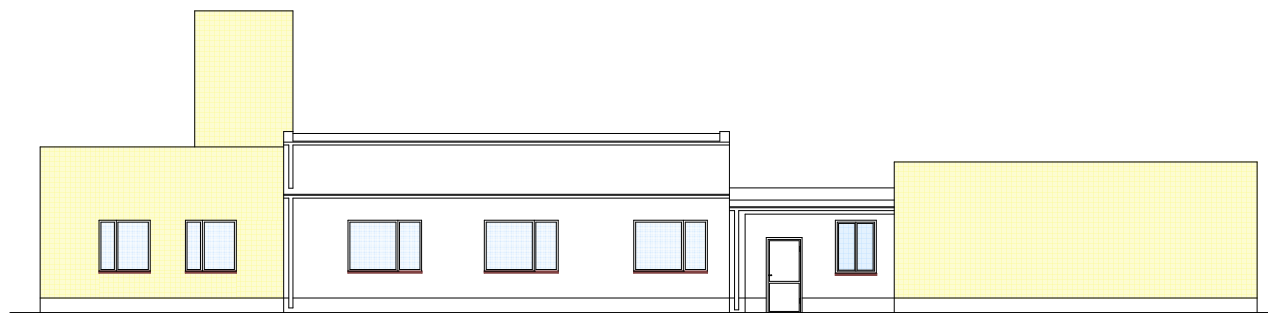
Łączna powierzchnia elewacji pd.-zach. = 69,00 m 2